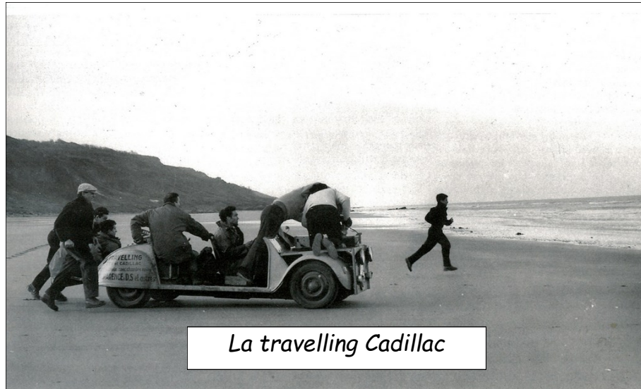
La travelling Cadillac